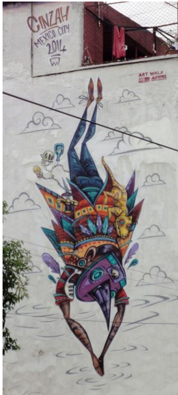
Imagen representativa / detalle /general